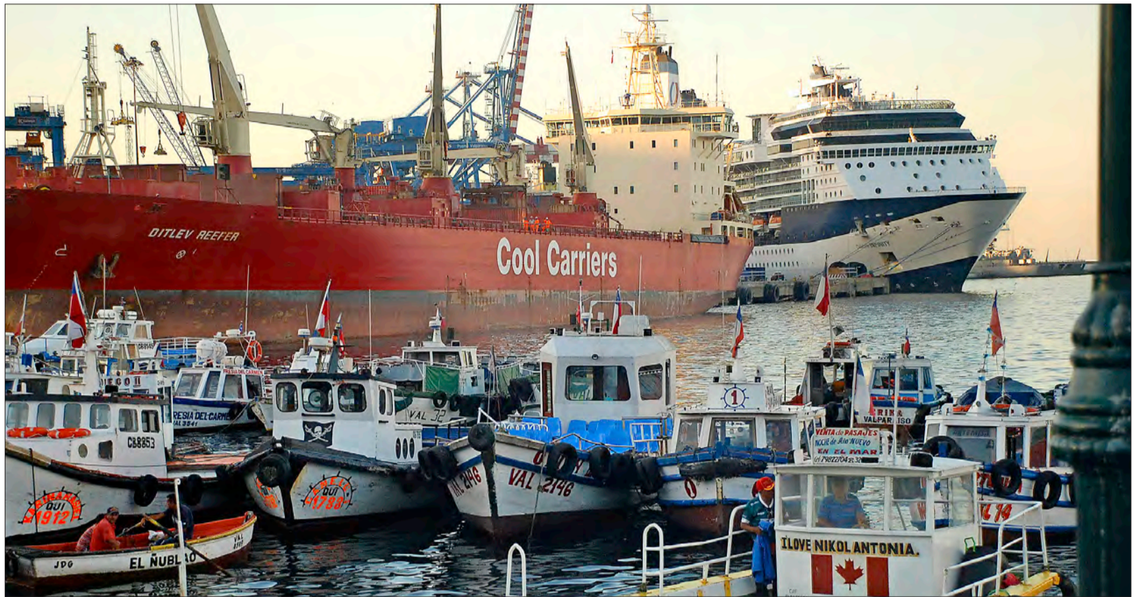
Hafenstadt für Träumer und Genießer: Valparaiso

M anchmal kreist ein Kondor über die auf 2300 Metern Meereshöhe gelegene Wüste aus Stein und Sand. Der mächtige Vogel mit bis zu drei Metern Spannweite gehört zu den wenigen Lebewesen, die sich mit der kargen Landschaft in den chilenischen Anden arrangiert haben. Selbst der Mensch versucht, so wenig Zeit wie möglich in der Einsamkeit der Berge zu verbringen. Ist ihre Schicht beendet, nehmen die Arbeiter der El Teniente-Mine einen der vielen Busse, um wieder ins Tal zu gelangen. Sie schürfen in der Höhe nach Kupfer.