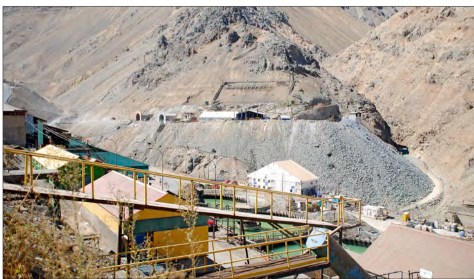
Schatzkammer Chiles: die Kupfermine El Teniente

Wie brutal Pinochet gegen seine politischen Gegner vorging, zeigt das Museum „Museo de la Memoria y de los Derechos Humanos“ (Museum der Erinnerung und der Menschenrechte) in Santiago. In Büchern kann der Besucher die Schicksale der Getöteten, Gefolterten, Verschleppten und ins Exil Getriebenen nachlesen. Ein Film erzählt die Geschichte des 11. September 1973 – jenem dramatischen Tag, an dem Pinochet die Macht übernahm, die Residenz des gewählten Präsidenten Salvador Allende stürmte und bombardieren ließ, und der sozialistische Staatschef starb. Für viele war Allende ein Hoffnungsträger. Ihm trauten insbe-